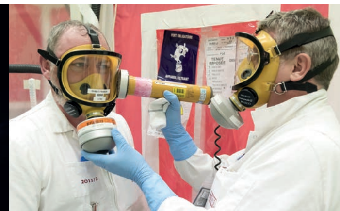
Contrôle radioprotection en sortie d'intervention