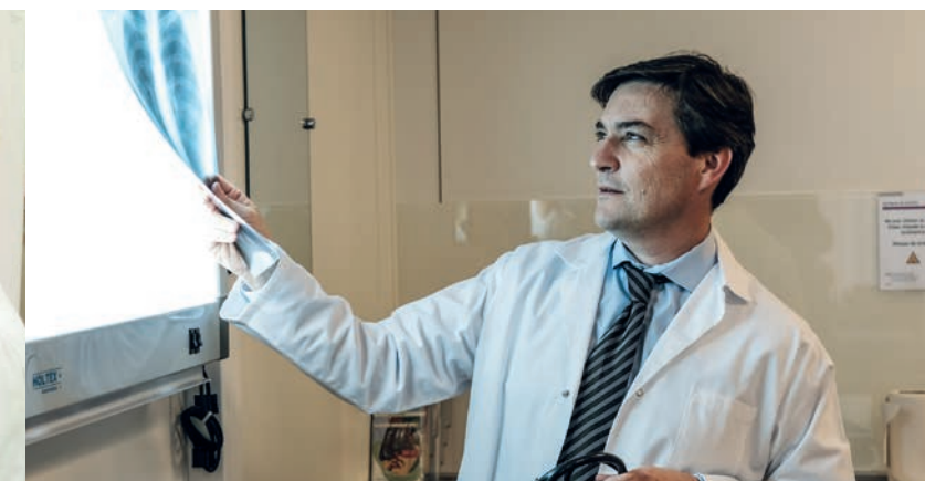
Examen médical pour le suivi de la santé au travail